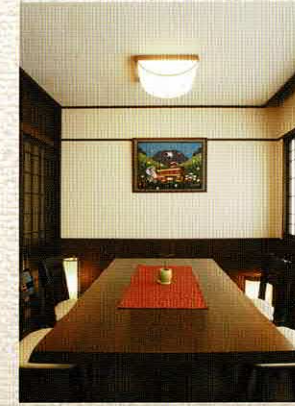
御食事処「かじか」「蔵王」