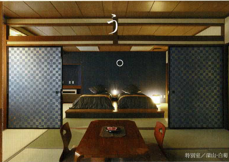
特別室／深山・白菊