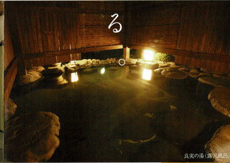
良実の湯 (露天風呂)