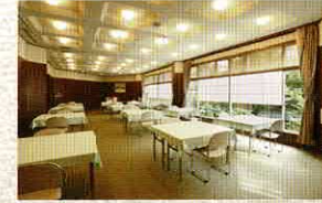
バンケットホール「朝日」