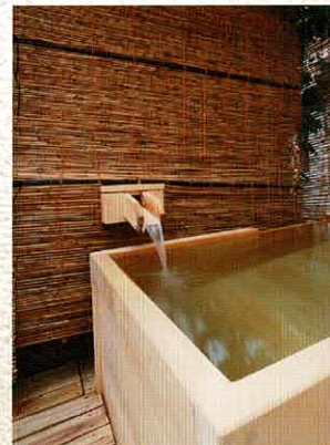
小町の湯 (露天風呂)

美人の湯として語り継がれてきた小野川温泉の泉質は「含硫黄・ナトリウム・カルシウム・塩化物泉」。無色透明で微かに硫黄の香りがする。また、大量に含まれるメタケイ酸がコラーゲンの生成を助け、肌をツルツルにする作用をもつカルシウムイオンとの相乗効果で肌のセラミドを整える働きがある。