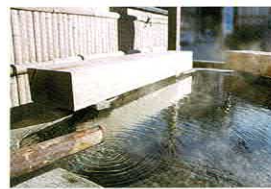
足湯：旅館組合駐車場