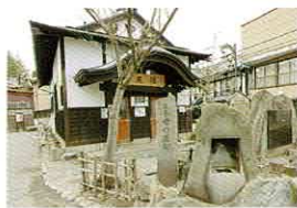
飲泉所：峰の薬師… 尼湯前 飲泉所：小野小町… 旅館組合駐車場