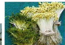
豆もやしあさつき (12月~3月限定)