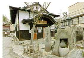
飲泉所：峰の薬師… 尼湯前 飲泉所：小野小町… 旅館組合駐車場