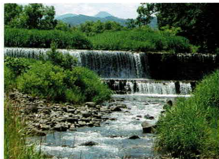
吾妻山の清冽な流れ（鬼面川）

米沢市の郊外、鬼面川（おものがわ）沿いの自然豊かな落ち着いた風情が自慢の温泉。小野川温泉の“小野”は、平安時代の美人の象徴・小野小町に由来します。1200年ほど前、父を慕い京都より旅立った小町が病に倒れたとき、この地の温泉につかり、病も癒え、絶世の麗人に生まれ変わったという伝説から“美人の湯”ともいわれています。伊達政宗や米沢藩主・上杉鷹山もこよなく愛した名湯です。